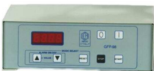
quadro elettrico – electronic device code GFP-98