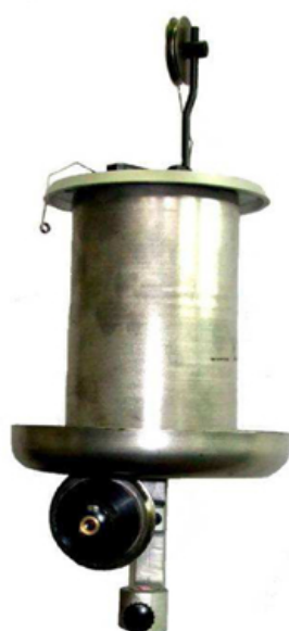
cono portamatassa – skein holding cone code 005 02 G00