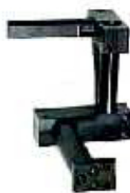
supporti universali - universal supports code 105 03 G00