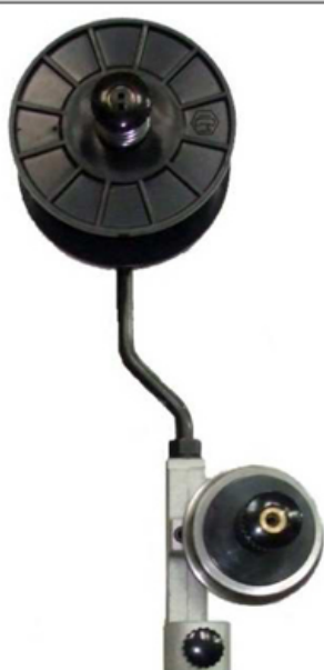
portarocchetto – reel-holder; code 005 02 G01